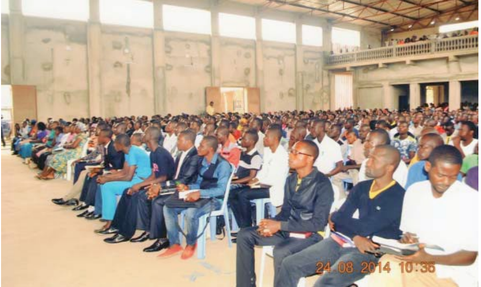
Angolassa ovat syntyneet suuret seurakunnat, jotka ovat kaikki meihin yhteenliittyneinä. Valokuva näyttää uskovia, kun he seuraavat internet-lähetystä Lontoosta.