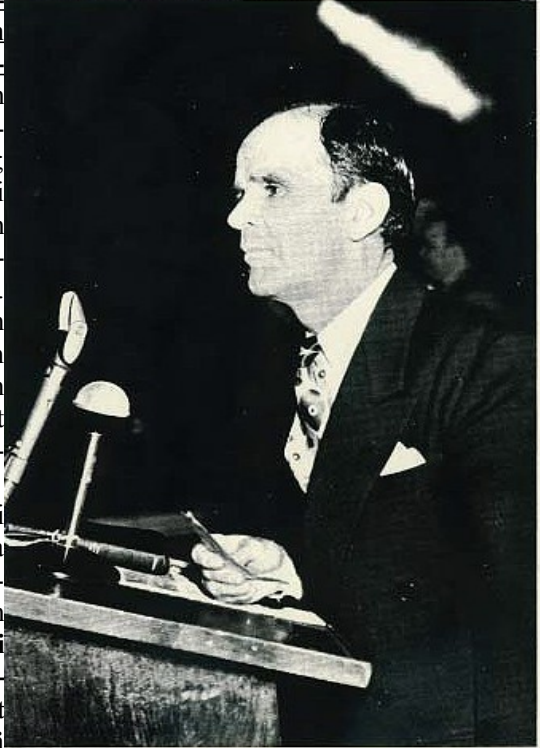
William Marrion Branham

The Pillar of Fire over Brother Branham's head was photographed at Houston, Texas, in January of 1950, and had accompanied him since his birth in 1909. During a 1933 baptismal service in the Ohio River at Jeffersonville, Indiana, this supernatural Being appeared before hundreds of people, saying to him, "As John the Baptist forerun the first coming of Christ, you will forerun His Second Coming."